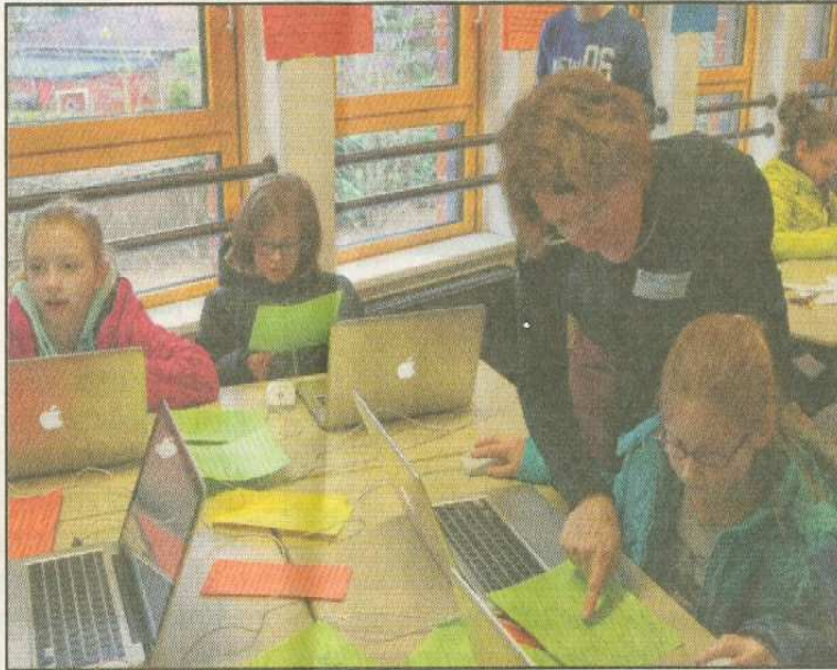
Schnupperunterricht am Präsentationstag.